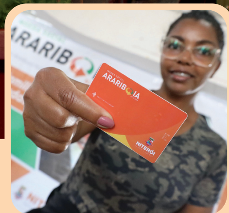
Moeda Social Arariboia: mais de R$ 240 milhões injetados na economia local.

INVESTIMENTO HISTÓRICO NO MUNICÍPIO: MAIS DE R$ 2,3 BILHÕES EM 4 ANOS.