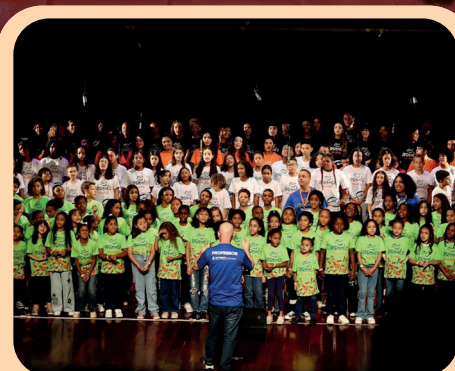
Ampliação do Aprendiz Musical: 10 mil estudantes atendidos.