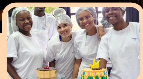
Niterói Jovem EcoSocial: mais de 1.500 jovens atendidos.